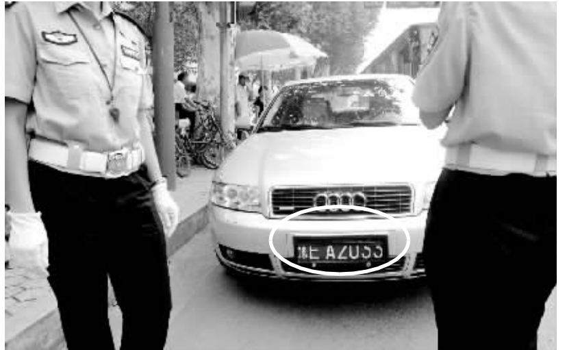
只遮住半个车牌的遥控布帘没能逃出两名民警的目光。