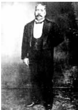
旧上海“地皮大王”欧司·哈同

在中国近代史上，房地产市场风云变幻的背后从来就不缺少外资的身影，而在100年前的上海，由犹太人组成的“炒房团”通过炒卖地皮房产，在短期内积聚了巨额财富，成为了中国乃至整个远东地区最富有的群体。