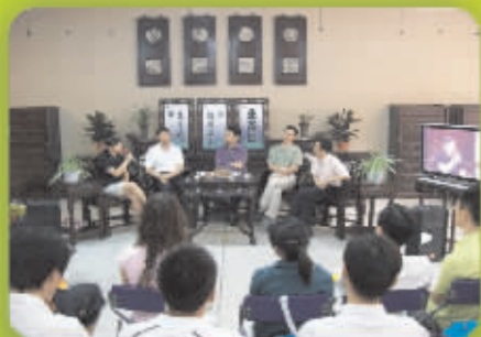
周末面对面拍摄现场

短信参与方法:移动联通用户编辑内容发送到1858359小灵通用户编辑短信内容发送到126680259 (奖品提供:郑州古玩城北茶城)