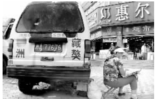
一辆破面包车车轮已经没气了,靠一堆砖头在车下支撑。

“长期停到这里,明显就是借车的外壳打广告。”记者联系郑州市城市管理行政执法局,一李姓工作人员表示,破车停在闹市,外面做广告牌,里面办公用,这样的车辆实际上就是一幢“违章建筑”。他们会去调查核实后处理。