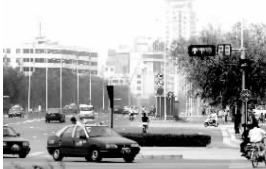
宽阔的未来路。

“按照规划要求,这次未来路扩建改造的交通饱和年限为20年,设计时速50公里。”史松合介绍,现在的未来路拆除了原路行车道内的花坛,在原有50米的规划红线内对人行道、绿化带和行车道进行调整。“原行车道是15米,现是23米,未来路变得更加顺畅。”