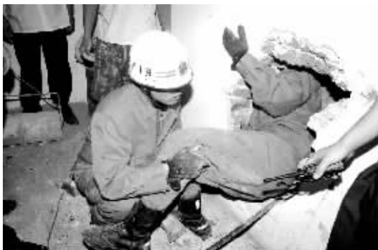
消防人员半个身子钻入洞中营救孩子。