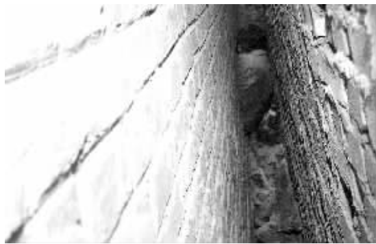
孩子掉进 30 厘米宽的两楼夹缝中。