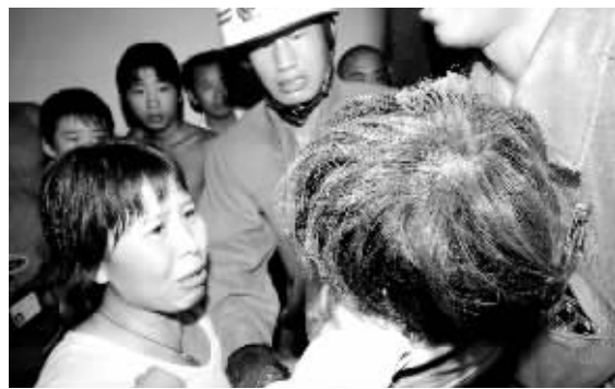
孩子终于被救了出来,母亲心疼得不得了。