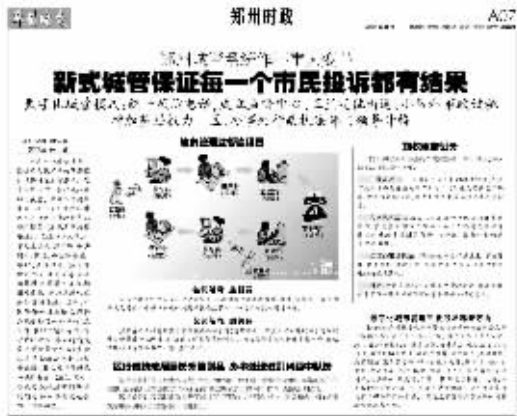
本报8月9日A07版的相关报道

同时,市城管监督中心分派到全市各街道、社区的城管监督员,发现问题后拍照随时反馈至市城管监督中心,然后分派下去进行处理。届时,市民除了拨打12319投诉电话外,可随时向身边的城管监督员反映问题。市民也不用担心监督员会不会出现偷懒、不反映问题等情况,市城管监督中心通过对监督员持有的城管通进行卫星定位,监督员的活动情况全在掌握之中。