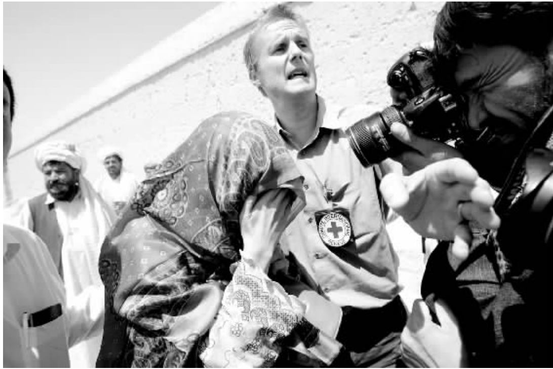
8月29日，红十字国际委员会工作人员在阿富汗加兹尼搀扶被释放的韩国女人质离开。这是阿富汗塔利班武装组织当天释放的第一批3名韩国女人质。

据韩国官员28日介绍，人质获释后，将先被送往喀布尔接受体检，然后再返回韩国。但韩国驻喀布尔大使馆官员29日说，获释的人质可能将先被送往喀布尔以北的巴格拉姆美军基地，然后“尽可能快地离开阿富汗”。