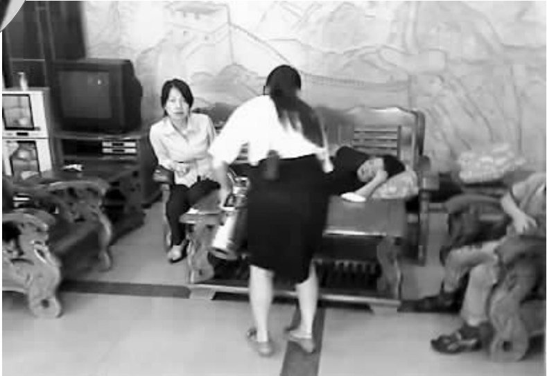
受害人摔伤处和当时受伤情景(资料图片)