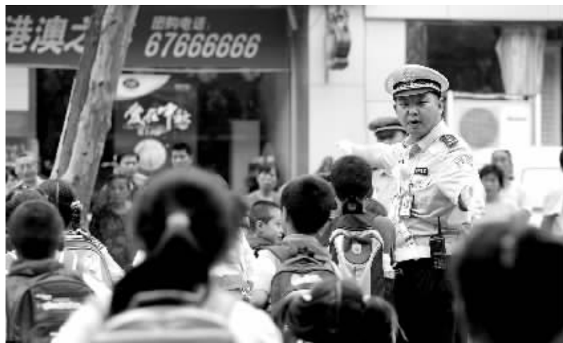
□见习记者 王晋晋 晚报记者 刘德华 通讯员 孙勇 朱乾坤/文 晚报记者 赵克/图

昨日,市公安局特巡警支队联合教育行政部门,拉开了全市小学校周边环境整治的序幕。昨日上午,特巡警5个大队对辖区45所小学校周边商店、网吧等进行大规模的专项检查。行动将持续下去,今后,在上下学时间,民警将每天4次在学校附近巡逻。