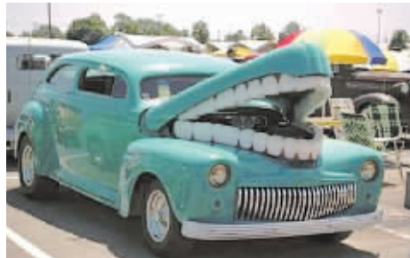
▲见过这么开心的车吗？