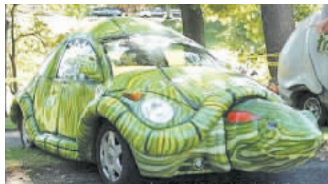
▲方便在森林里活动的乌龟车。