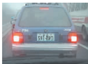
▲我就要人民币？！真直率……