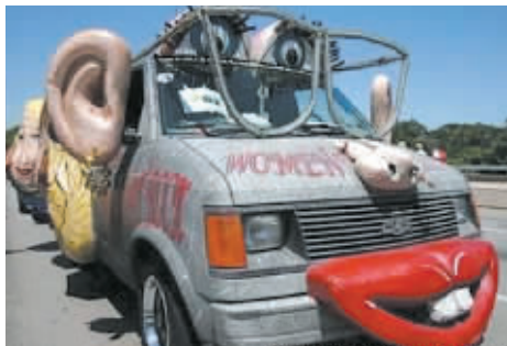
▲见过这么性感的车吗？