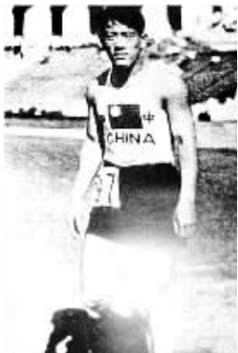
1932年,刘长春在洛杉矶第10届奥运会现场。