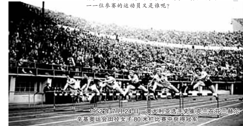
1952年7月24日,澳大利亚选手史崔克兰在芬兰赫尔辛基奥运会田径女子80米栏比赛中获得冠军

在新中国成立之前,中国奥运代表队曾由刘长春执国旗,沈嗣良为总代表,组成6人代表团,参加了1932年7月30日在美国洛杉矶举行的第10届奥林匹克运动会。中华体育协进会董事王正廷致欢送词说:“中华民国之国旗,飘舞于世界各国之前,是乃无上光荣也。”比赛开始后,刘长春百米预赛成绩在11秒左右,居第5位,被淘汰;200米成绩21秒9,居第4位。在美国停留数日后,刘长春于8月21日乘柯立芝总统号起程回国,结束了中国人的第一次奥运之旅。