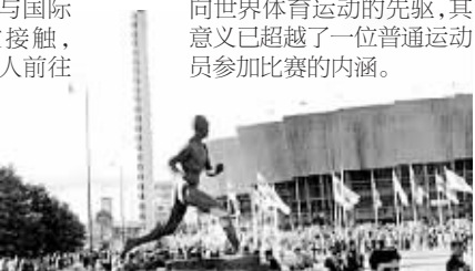
赫辛基运动场外的雕塑

到1932年的洛杉矶奥运会,现代奥运会虽然已经举行了10届,且早在1924年中国已经与国际奥委会有过接触,1928年还派人前往