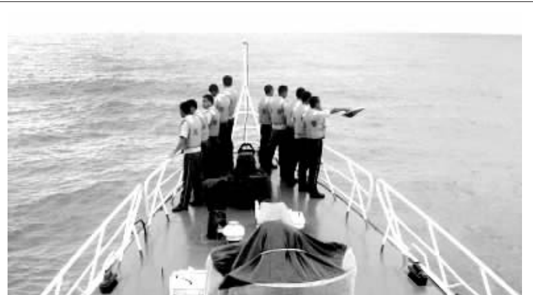
9月2日,浙江海警一支队官兵在海上进行搜救工作。

谈到新一届领导机构的计划,李佩甫表示:作家要靠作品说话,省作协要在全省作家中提倡“十年磨一剑”的精神,杜绝浮躁,创作出更多好作品。要更多地推出新人,包括网络文学时代的新生代作家,完善文学豫军的梯队建设。