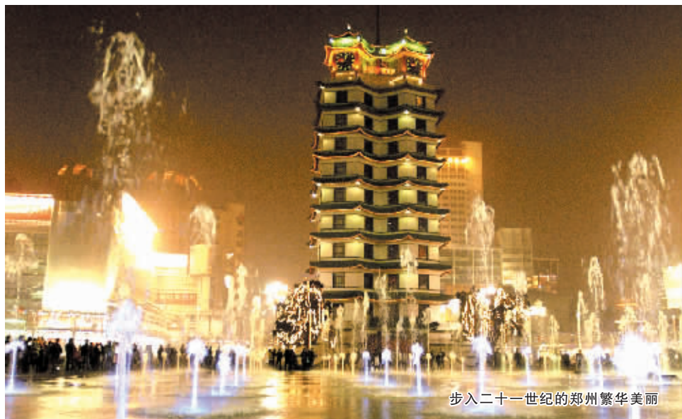
步入二十一世纪的郑州繁华美丽

查阅一下古代的河南政区图,发现当时的许郑范围还不小,它统领着许昌郡、颍川郡、阳翟郡三个郡和九个县。不过许郑的生命是短暂的,根据《太平寰宇记》记载,“从东魏到北周,这个郑州只存在了32年”。