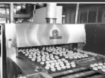
隧道烤炉二次烘烤,月饼成熟