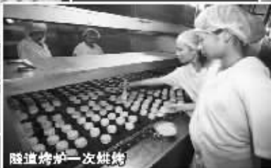
隧道烤炉一次烘烤