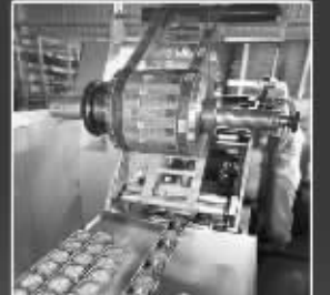
自动化包装线 月饼穿上美丽外衣