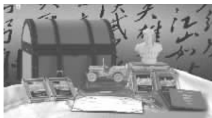
限量版发行810套，每套均有唯一编号！

世界第一部采用纯金、纯银、钻石、红宝石打造的阅兵车车模 世界上发行量最少的阅兵车车模 世界上第一部军队受阅车车模 世界上第一部领袖阅兵车车模