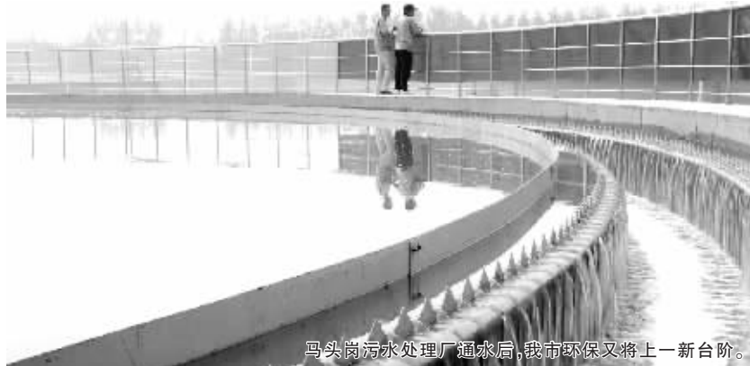
马头岗污水处理厂通水后，我市环保又将上一新台阶。