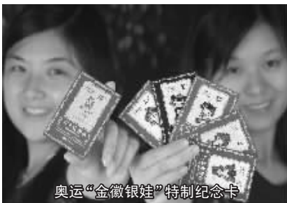
奥运“金徽银娃”特制纪念卡

据业内专家介绍,这套纪念卡具有很高的欣赏价值和收藏价值,并一举刷新奥运藏品的纪录。首先,它是由北京奥组委审核批准的木质镶金银奥运纪念卡;第二,它是世界上罕有的奥运异质纪念卡;第三,它完整收录了43种奥运福娃造型,其中5个常态福娃和38个运动福娃第一次实现了在异质电话卡上的大团圆;第四,它是一部对北京2008年奥运