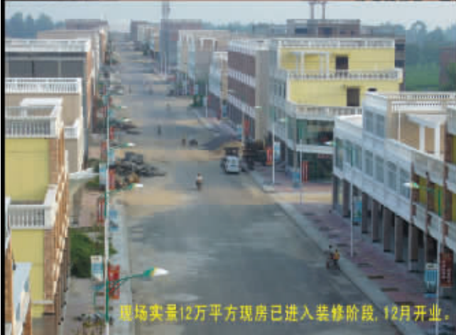
现场实景12万平方现房已进入装修阶段，12月开业。