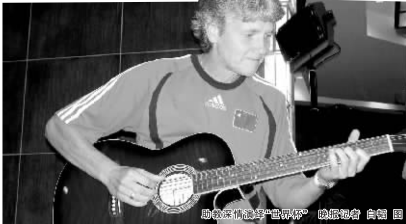
助教深情演绎“世界杯” 晚报记者 白辑 图

昨天女足世界杯没有比赛,首战告捷的中国队进行了赛后的第一次调整训练,前天比赛中出场的队员在驻地的游泳池进行了游泳放松,而没有比赛的则在昨天中午在多曼斯基的带领下进行了一个小时的训练。下午3时,女足姑娘们和她们的亲属在明珠豪升大酒店六楼进行了一场温馨的见面会。 晚报记者 董洪刚 武汉报道