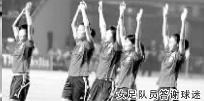
女足队员答谢球迷