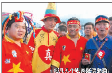
哥们几个明天还来加油!