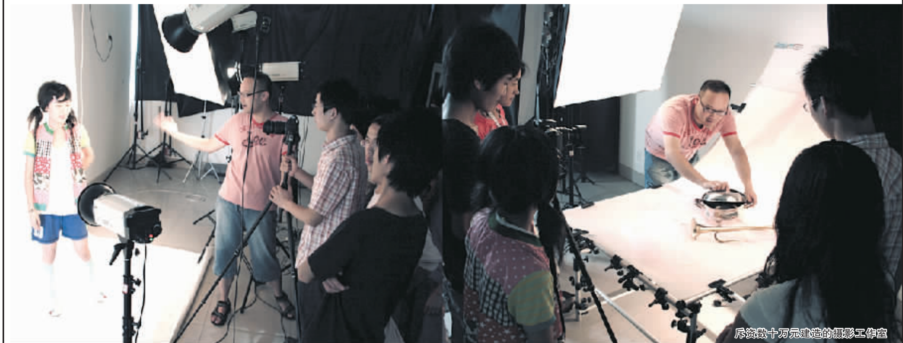
斥资数十万元建造的摄影工作室