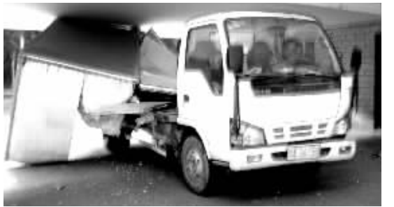
驾驶室里的两个人一时不知所措。