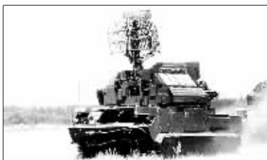
“托尔-M2”型导弹防御系统定于2008年开始生产。