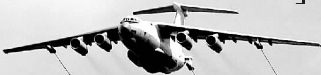
◀伊尔-78型加油机系伊尔-76的改进型,能在空中以每分钟2000升的速度为飞机加油。

当地时间20日,俄罗斯官方宣称,最近的一次深海考察结果证实,“北冰洋海底属于俄罗斯”,北 极的120万平方公里地区应属俄所有。同一天,俄空军发言人说,两架俄罗斯图-95MS型战略轰炸机 在演习中沿美国阿拉斯加沿海和加拿大沿海飞行大段距离。