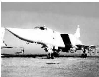
图-22M3型轰炸机被北约称为“逆火”式轰炸机,这种飞机能携带核武器,但用于执行常规作战任务。