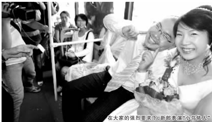
在大家的强烈要求下，新郎表演“小鸟依人”

10时30分，一对新人在三棉社区登车，婚礼的主持人看到媒体记者前呼后拥，还干脆安排了现场采访。