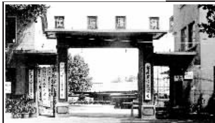
◀位于人民路2号的 郑州公交总公司老址