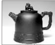
金陵风云壺 (为国际体联安德鲁·F·盖什布勒阁下特制)