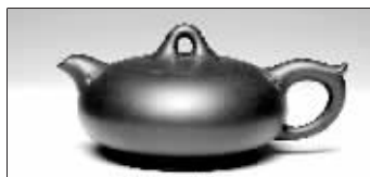
扁灯如意壺(紫泥胎质,散氤氲之光;嘴、把与壺身相处,缀有玲珑如意;灯笼既“登隆”,有民间吉庆趣味。)

其经营模式分为三种:一是自己或聘请美术师进行创作设计,然后交由大师创作,大师从中领取工资;二是为大师提供场所,进行设计制作,公司负责组织销售,从中提成,或购买大师的作品再出售;三是根据订单需要,组织工人进行集中生产。这种方式使各种级别的壺都有了个正规、长久统一的销售模式,也使紫砂行业从制作到销售有了可以监督的可能性。