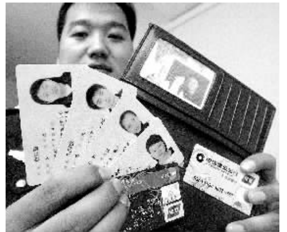
□见习记者 王晋晋/文 晚报记者 周雨/图

本报讯 十一出游,钱包和证件丢了,这些烦心事你遇到了吗?特巡警四大队民警昨日向本报求助,他们巡逻时捡到的两个钱包、两张信用卡和4张二代身份证,请失主尽快来认领。