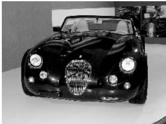
售价 298 万元的威兹曼跑车

“他们对奢侈品有很高的购买热情。名车、高档手表、珠宝、房产,都是他们购买的对象。每年北京至少有 30%的高档奢侈品是被这 4 个地方的消费者买走的。”盛磊说。他介绍,30%的数据是根据各大奢侈品在北京的销售反馈估算出的。