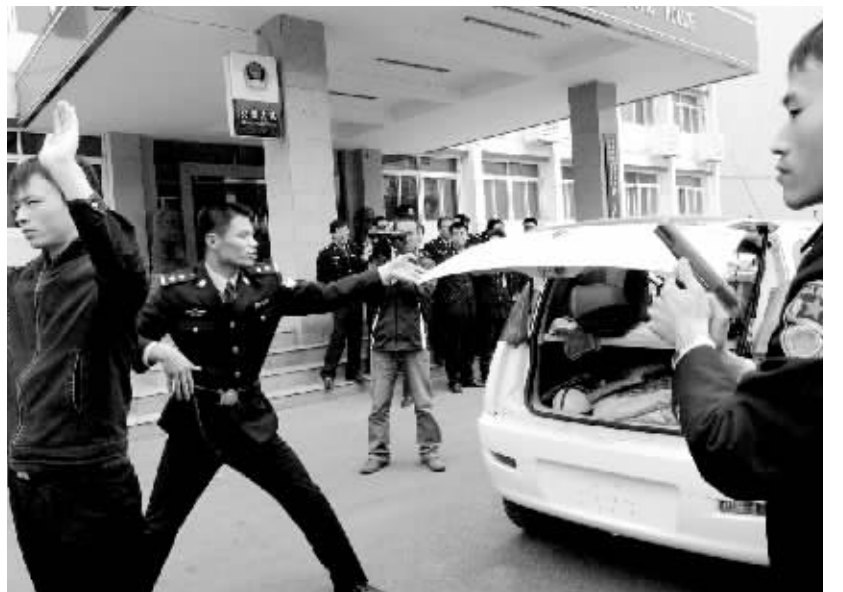
特巡警现场演练如何应对执法突发案情时的自我保护要领。

只需按一键,剩下事情交给汉王文本王:整页资料自动进电脑,可生成Word、Excel、PDF等通用格式,准确率