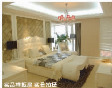
实景样板房 实景拍摄

THE PALM CHARGES LIFE OF THE CAPITAL QUEEN