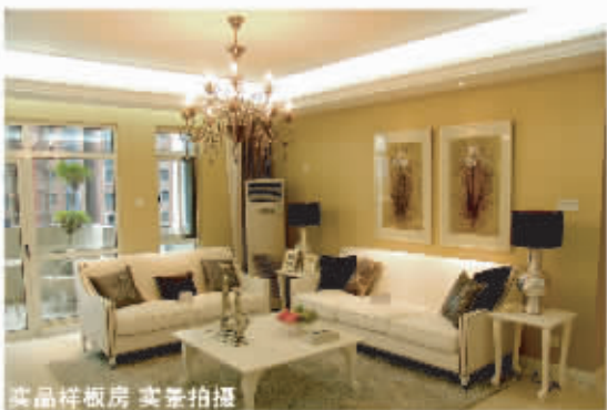
实景样板房 实景拍摄