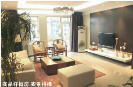
实景样板房 实景拍摄

3重 ①交1万抵2万 大礼 ②鉴赏样板房送价值2000元"购屋金卡" ③看房即送精美礼品