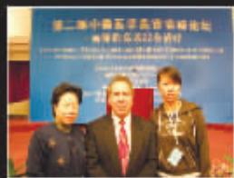
我院专家与美方专家学术交流