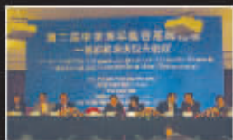
中美整形名家出席第二届医学美容峰会(中国·青岛)