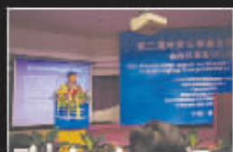
整形专家发表除皱学术演讲