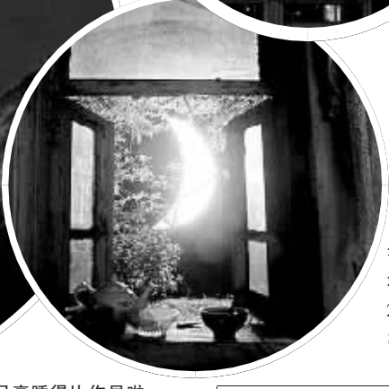
◀窗外明月,还可以24小时亮着哟