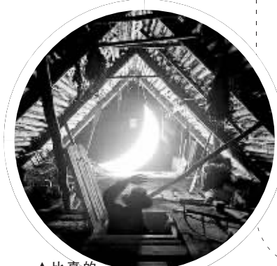
▲比真的还酷,这是为地下室设计的

很多时候,天公不作美,月亮睡得比你早。那怎么办?当然是自己做个月亮啦!你不是创意达人,有创意即可。一群俄罗斯设计师已经设计出了一种极像月亮的灯,把它放在家里,就成了私人月亮啦!看看效果有多酷。