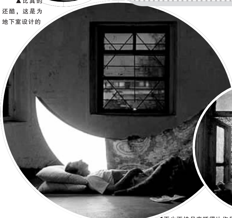
◀再也不怕月亮睡得比你早啦