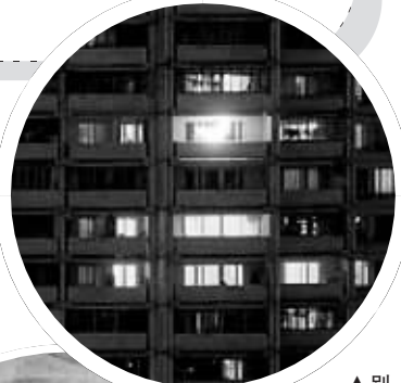
▲别人家都没有月亮,就你家有,嘿嘿