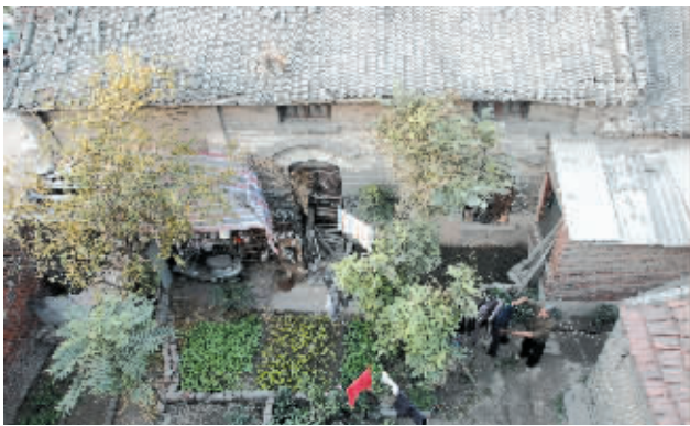
男主人在院子里晾晒衣服,时光在这里慢下了脚步。

主人栽种的葫芦,沐浴着午后的阳光,循着墙根蹿上了墙头,跟那棵上了年纪的石榴树呼应着,无声地诉说着远去的从前,还有这个平凡人家的田园故事。