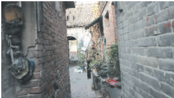
古老的院落里仿佛时光停滞,一切都十分安详。