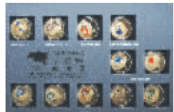
编号 121: 历届夏奥会吉祥物纪念章

精铜铸造,表面镀金,记录从1972年第20届夏季奥运会到2008年第29届北京奥运会,每套11枚,限量发行50000套。现发行浮动价660元。