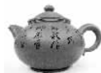
鲍燕萍作品《四季财旺》