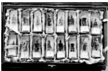
编号 118: 炎黄二帝

包括中国象棋和国际象棋。珍藏版中国经典兵马俑象棋,用不饱和树脂和石粉制作,棋子底部可作印章馈赠或收藏。大套市场价1200元,读者价880元;中套市场价880元,读者价680元;小套市场价360元,读者价280元。