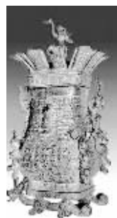
编号 112: 莲鹤方壶

1923年新郑出土,共一对,分藏于故宫博物院和河南博物院。方壶顶部的四周是重瓣向外翻仰的莲花,莲花中矗立着展翅欲飞的仙鹤,代表中国已经进入百家争鸣、思想自由的春秋时代。中号(高26厘米),市场价780元,读者价700元;小号(高21厘米),市场价560元,读者价500元。