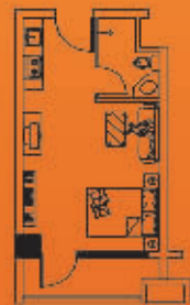
推荐面积 32.07m 2 (含赠送面积)