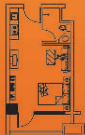
推荐面积 32.07m 2 (含赠送面积)