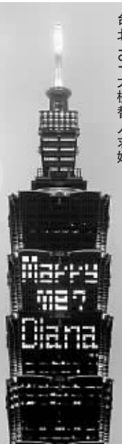
台北101大楼替人求婚