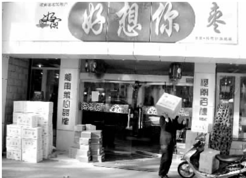
“好想你”店面装修形式统一

“我们生命中有太多的遗憾,有那么多长久以来被我们淡忘的亲情、友情和美好的爱情。而我们中国人的情感又是内敛的,不好意思说出自己的真实感受,只能保留在记忆深处。如果我们看望父母、兄弟、亲戚、朋友、爱人孩子时,送上印有‘好想你’品牌的产品。对方看到产品上的标志,不用说话就理解了其中包含的种种情感。”最后,在石聚彬的提议下,大家一致赞同这个富有诗意的名字。就这样,以“好想你”为牌子的枣产品问世了。