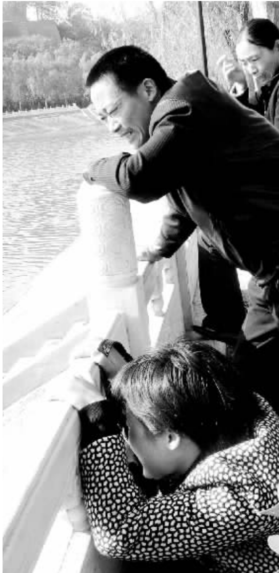
在孩子出事地点,家长泣不成声。

11月4日,记者电话联系到荥阳一中的高副校长,他坚决地说学校没有补课,老师补课是个人行为,与学校没有任何关系。他表示,学校将会调查此事,如果有哪个班主任给学生补课了,他们会严肃处理。