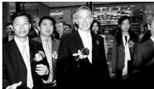
布莱尔在东莞演讲近1个小时,按照255.75万元计算,平均每分钟“吸金”42625元人民币。