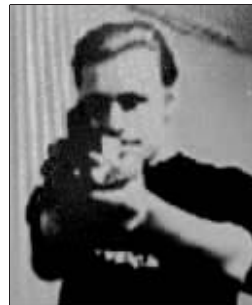
这是7日从视频网站 YouTube 获取的据称是凶手奥维宁上传的视频截图。

“Sturmgeist89”在网上称自己是个“社会达尔文主义者”。他说:“我已经作好战斗的准备,并将为我的事业而死……作为一个大自然的选择者,我要干掉那些