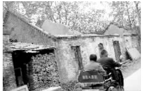
村民们都搬到了新房子里了,老房子渐渐破旧下去。