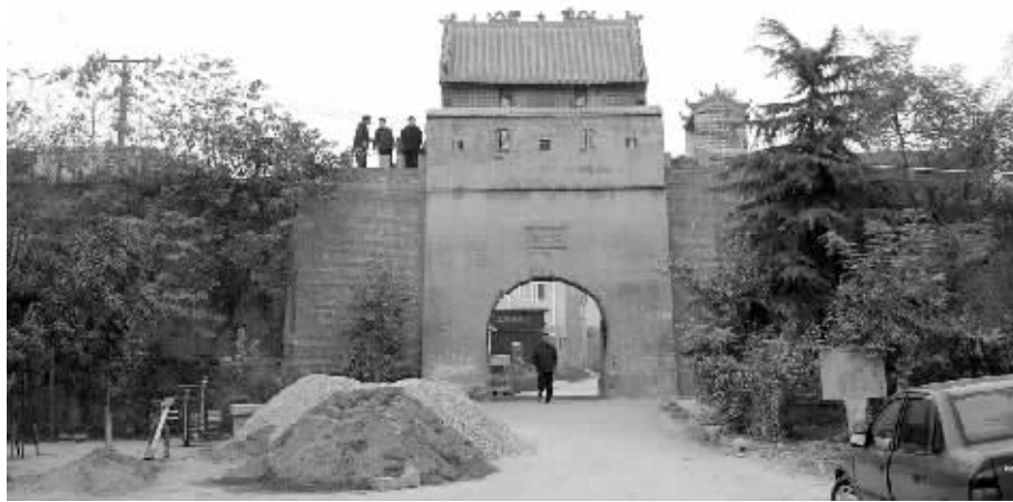
走在保吉寨城门下,恍然间今夕何夕。