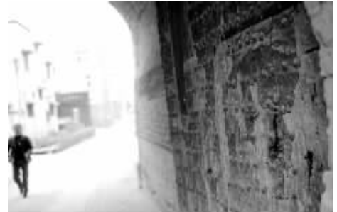
保存完好的清朝古城门。

昨日17时50分,记者与须水创建办孔主任联系,把市民的投诉转交给他,孔主任说,他将立即派人到现场偷倒的垃圾进行调查,找出责任人后对其处罚。