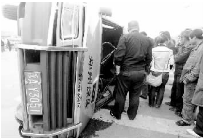
押款车的挡风玻璃碎了一地