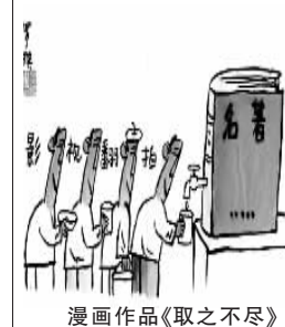
漫画作品《取之不尽》