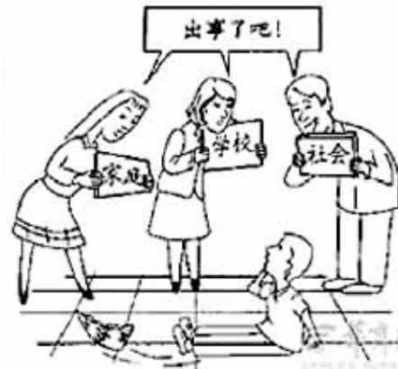
高考作文配发的漫画