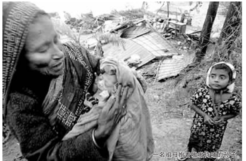
一名祖母抱着嗷嗷待哺的孙子。

孟加拉国媒体 11 月 16 日报道说, 15 日袭击孟加拉南部沿海地区的强热带风暴“锡德”迄今已造成 425 人死亡, 数千人受伤, 并迫使超过 65 万人实施撤离。路透社援引孟加拉国救灾部门官员的话说, 强风暴带来的降雨以及推高的水位淹没了 3 个沿海城镇。随着救灾部门获得更多受灾最严重地区的情况, 强风暴造成的死亡人数可能“急剧上升”。