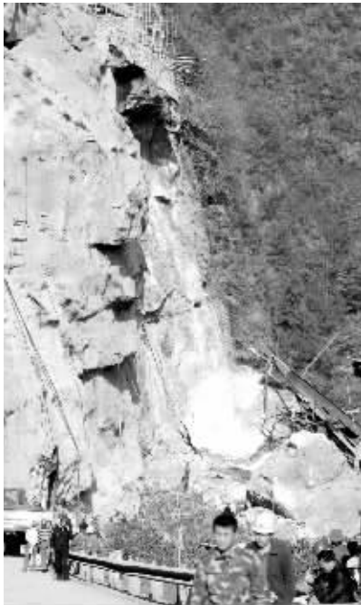
11月23日拍摄的岩崩滑坡事故后的宜万铁路高阳寨隧道。

20日8时40分，宜万铁路湖北省恩施州巴东县木龙河段高阳寨隧道进口处发生岩崩形成滑坡，滑坡体方量约3000立方米，造成在隧道进口处铁架上施工的4名民工1人死亡、1人受伤、2人被埋。滑坡巨石将318国道掩埋约50米长的路段。