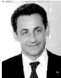
法国总统 尼古拉·萨科齐

法国总统尼古拉·萨科齐1955年1月28日出生于法国巴黎。曾在巴黎政治学院学习,获法律硕士学位。