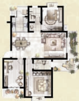
T 三室两厅两卫 约129㎡