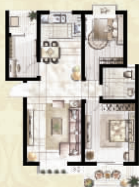
Q 三室两厅一卫 约89㎡