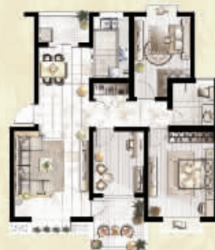
R 三室两厅一卫 约102㎡