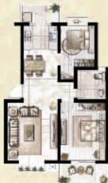
N 两室两厅一卫 约80㎡