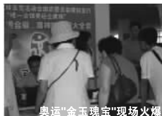
奥运“金玉瑰宝”现场火爆

据悉，“奥运金玉瑰宝”在北京首发引起轰动，除奥运收藏投资者认定它的价值潜力外，各界名流更是趋之若鹜，某公司老总把现场20套样品当场买断。他说：“能获得奥运奖牌