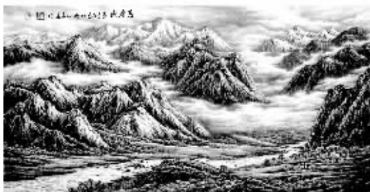
《高原赋》石长安国画作品

1939年生于西安市,祖籍河南太康,笔名石途,别署清泉阁主,中国书法家协会会员,中国国画家协会理事,河南省美术家协会会员,河南日报社副秘书长,国家一级美术师。