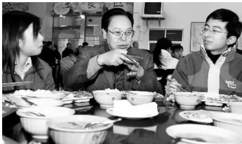
餐桌上,省委书记徐光春和同学们谈笑风生。

12时整,徐书记来到了学生食堂“秋桂园”。已经来过两次的他,看起来早已经轻车熟路了。进门,乘电梯上二楼,找桌子,他随意地坐在了已经围坐了俩男生俩女生的餐桌旁,要了一份跟四位学生一样的套餐:四个菜分别是西红柿炒鸡蛋、青椒炒肉丝、白菜烧豆腐、小酥肉,外加一碗免费的玉米糁汤。