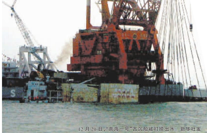
12月21日,“南海1号”古沉船被打捞出水面。

记者在现场还了解到,今天,还将有一排护卫舰队护送“南海1号”,“南海1号”出水后将举行出水仪式,然后被固定在一艘拖运过7000吨水泥石头的拖船上,运送到海上丝绸之路博物馆的临时码头,预计拖运过程需要8-9个小时。